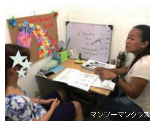
マンツーマンクラス

なんでもかんでもダメ、禁止などをするのではなく、本人の自己決定を応援するスタイルを当留学では取り入れております。多文化と触れ、行動の責任なども本人に委ね、任せ信頼する姿勢を示し、本人の自律性、自発性を大切に留学を提供しております。「信頼する = 愛されている = 自信を身につける」この考えが基盤ではありますが、なにもかもが自由でわがまま放題にさせるという訳ではありません。学校やホームステイ先のルールは守り協調し文化と社会性を培う、そして心身ともに成長できる環境が自然と整っているのが留学の魅力です。