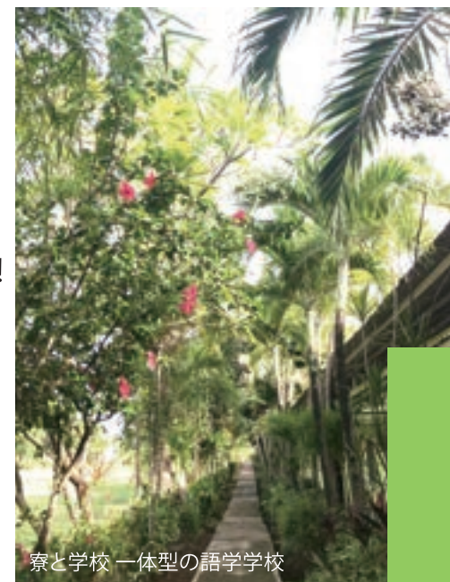
寮と学校 一体型の語学学校